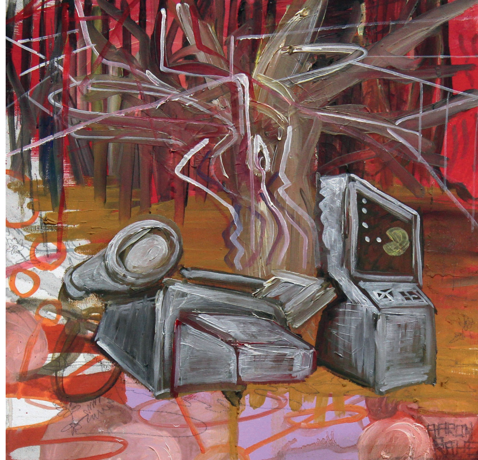
„Kabelbaum“, 50 x 50 cm, Öl und Acryl auf Leinwand, 2011