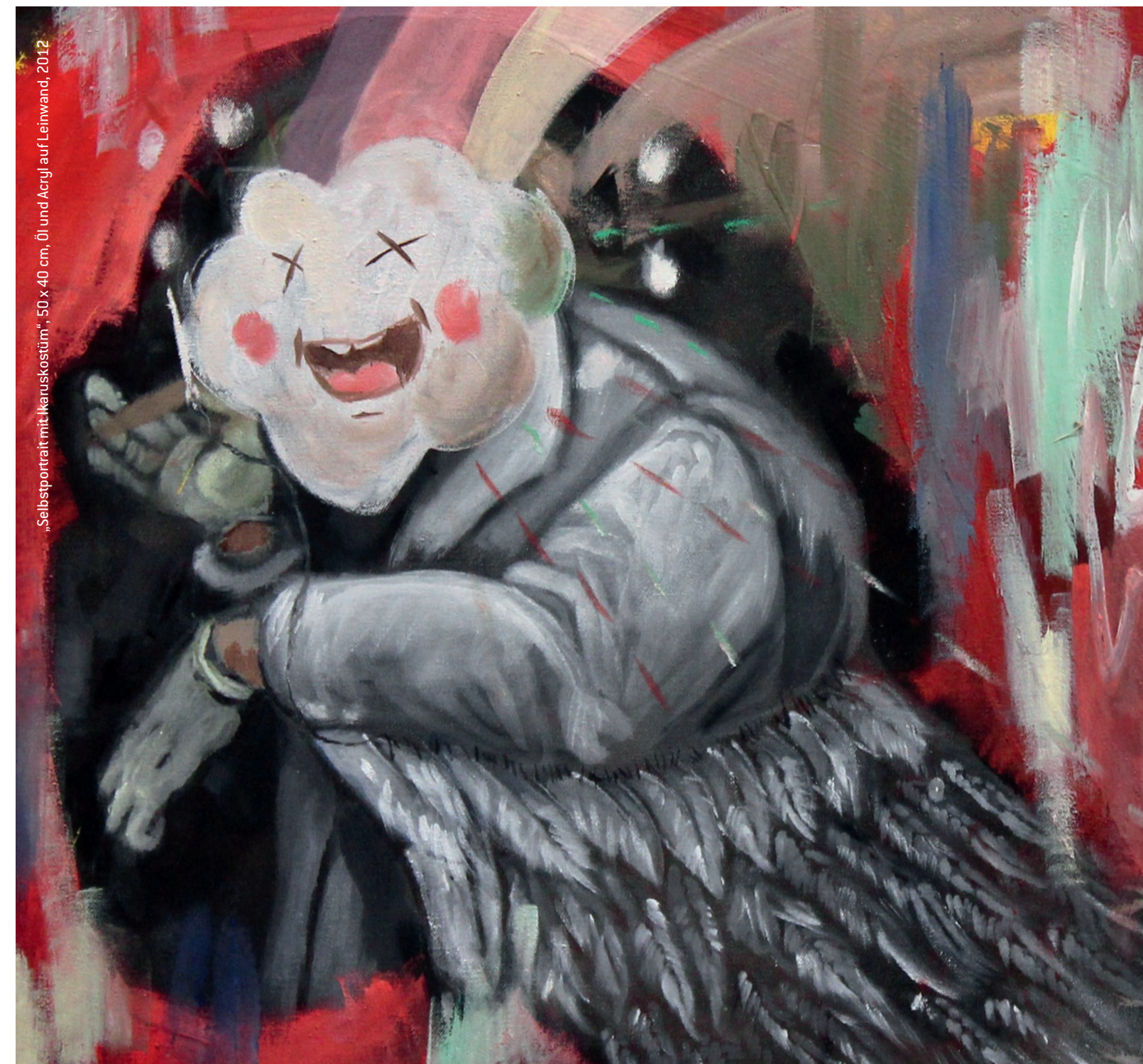
„Selbstportrait mit Ikaruskostüm“, 50 x 40 cm, Öl und Acryl auf Leinwand, 2012

REDAKTION: Kulturberatung Dr. Irmtraud Rippeit-Mantel Oldenburg GESTALTUNG: www.schwanke-raasch.de